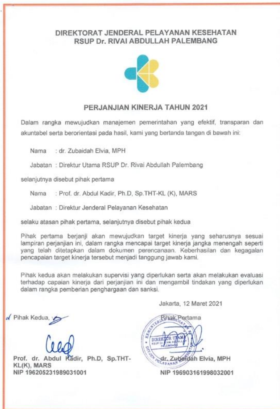
Gambar 2. 1 Perjanjian Kinerja Rumah Sakit Umum Pusat Dr. Rivai Abdullah Palembang Tahun 2021

Yang tertuang dalam dokumen perjanjian kinerja sebagai berikut :